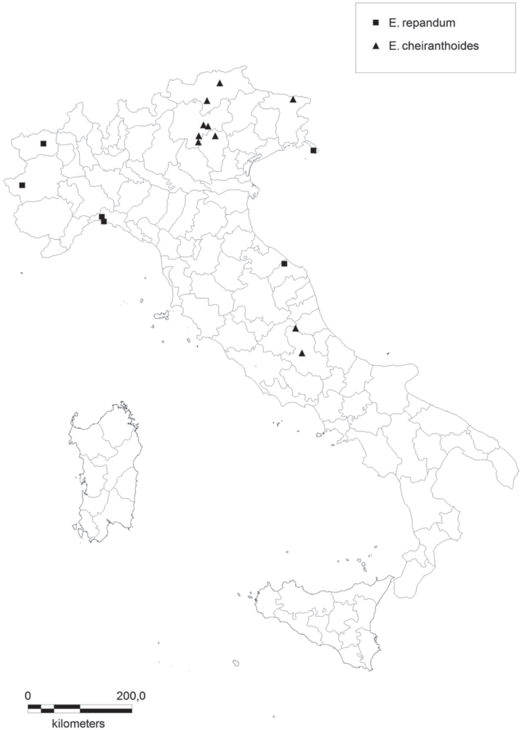
Fig 3: Distribution map of Erysimum cheiranthoides L. and E. repandum L. in Italy.