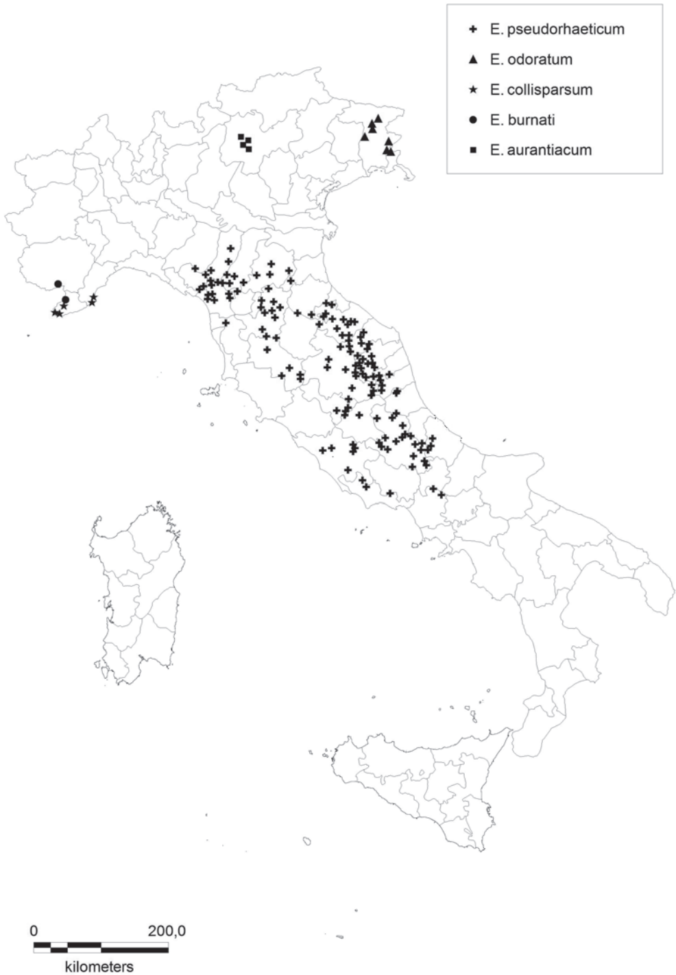
Fig 1: Distribution map of Erysimum aurantiacum (LEYB.) LEYB, E. burnati VIDAL in MAGNIER, E. collisparsum JORDAN, E. odoratum EHRH. and E. pseudorhaeticum POLATSCHEK in Italy.